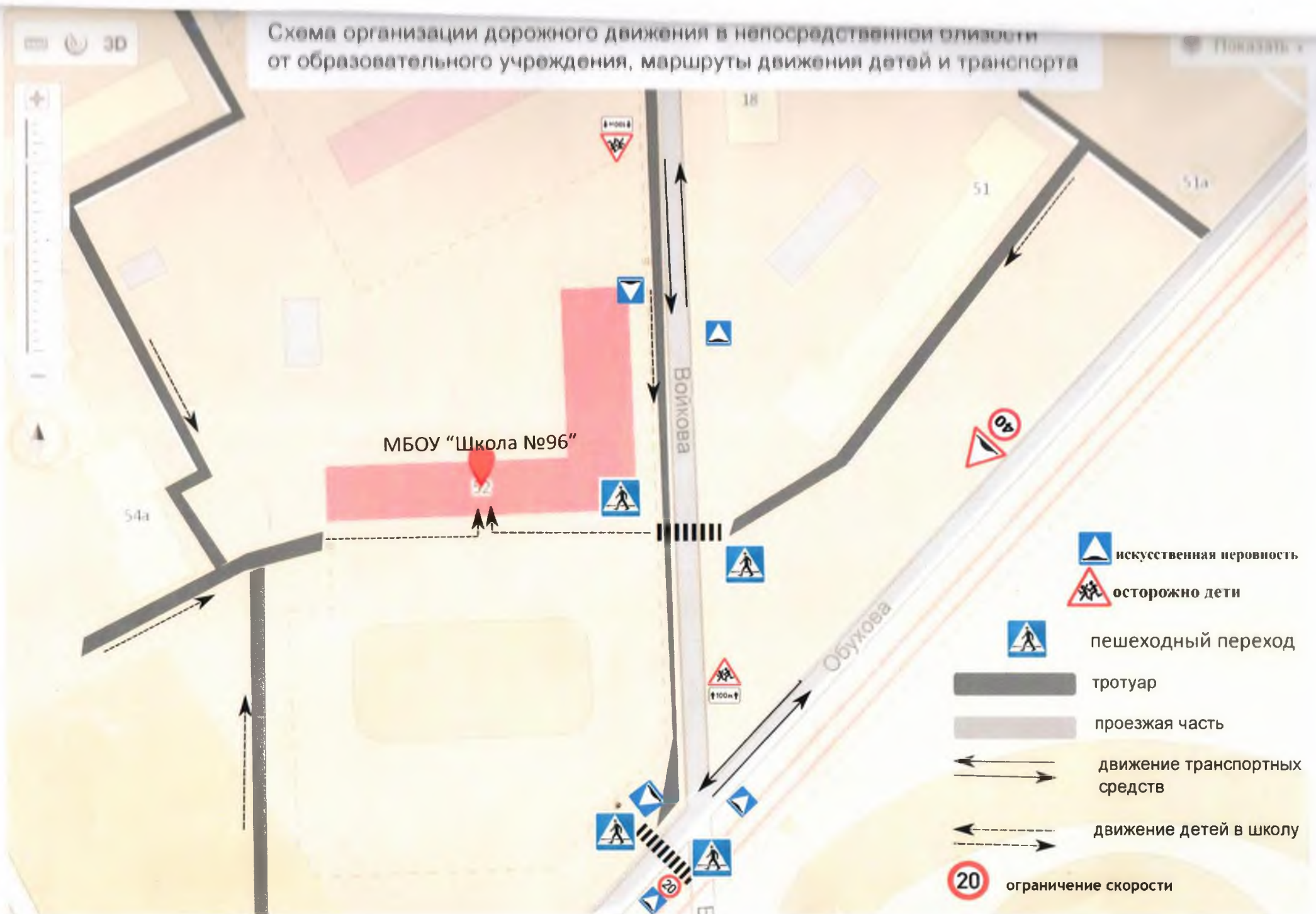
Схема организации дорожного движения в непосредственной близости от образовательного учреждения, маршруты движения детей и транспорта