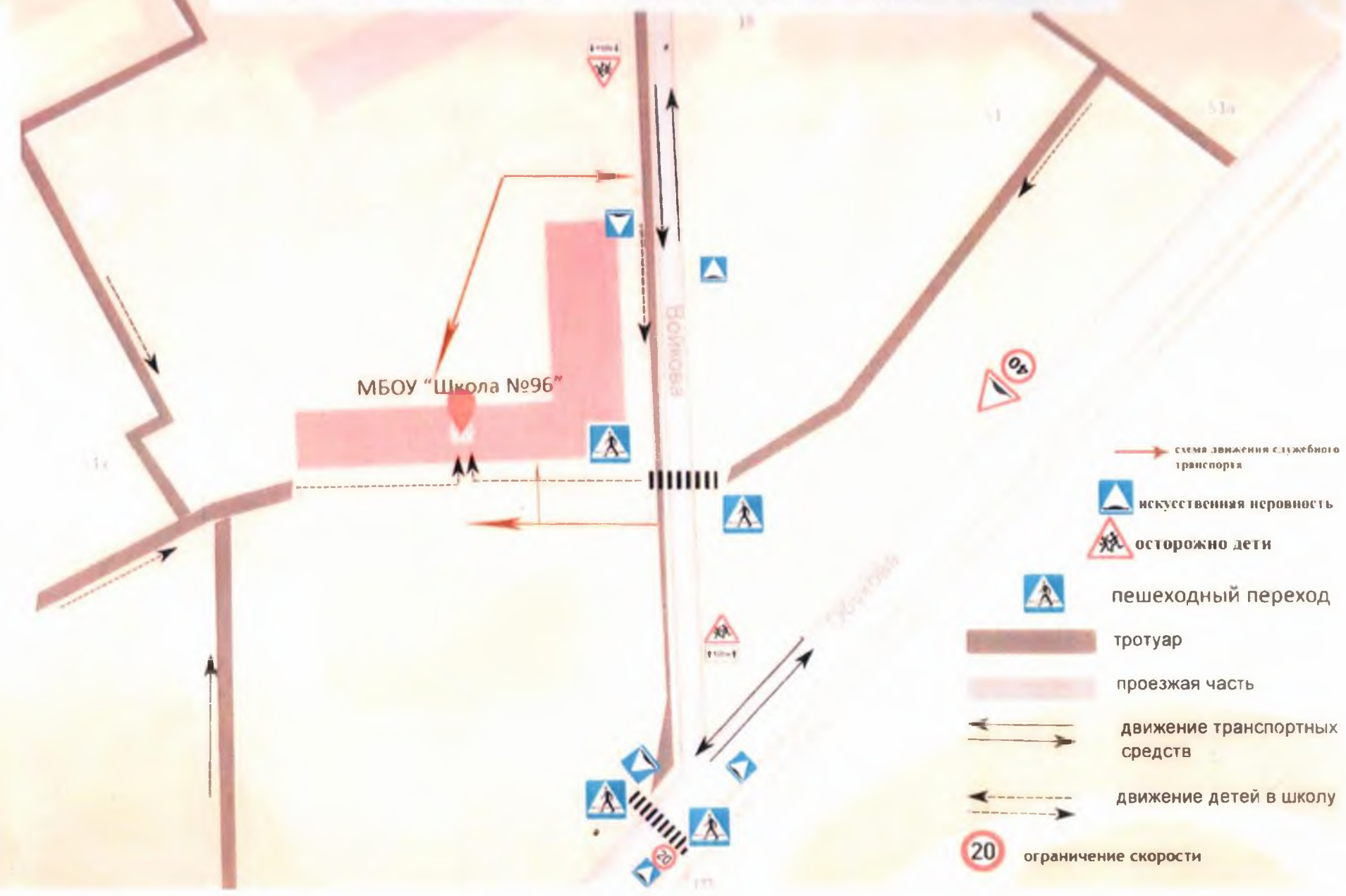
Схема организации дорожного движения и маршруты движения детей и транспорта от образовательного учреждения, маршруты движения детей и транспорта